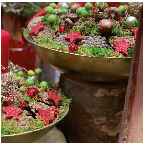
Table en fête